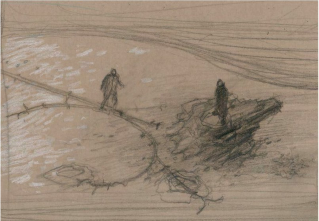
Dessins © Enki Bilal