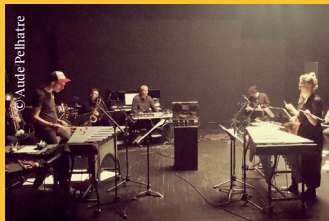
Figure emblématique pour de nombreux musiciens, Arthur Russell devient la matière du nouveau spectacle de l'ensemble O ! Give it to the Sky croise parité sur scène, scénographie et lumières de Christian Rizzo et Caty Olive et morceaux du compositeur à partir d'une collaboration ratée avec Robert Wilson. Un univers fascinant.