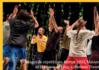
Images de répétitions, février 2023, Maison de la Danse de Lyon

Silver Rosa fait surgir la nécessité viscérale de créer du lien entre individus. Pour sa nouvelle création, Yuval Pick réunit un groupe de dix danseurs d'âges et d'origines diverses dans un paysage miroitant, aussi archaïque que futuriste. Avec eux, il invente de nouveaux mythes en s'appuyant sur des rituels folkloriques, des chants et des mouvements partagés.