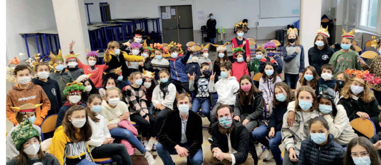
Les élèves de 6 e du collège Saint-Thomas d'Aquin, après la représentation de Shake the Tempest , le 9 mars 2021.